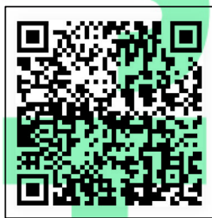
图 B.1 某排放口 QR 码生成示例

以上字符串共包含 118 个字母数字字符。采用 QR 码，符号规格设置为 41×41 模块（版本 6），设置纠错等级为 L 级（7%），生成二维码如图 B.1：